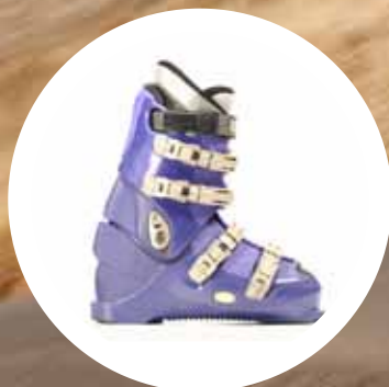
udobno na smučeh