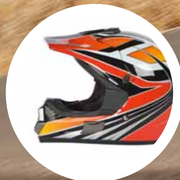
udobna zaščita glave