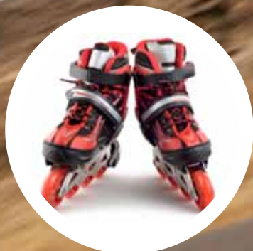
udobno na kolesih